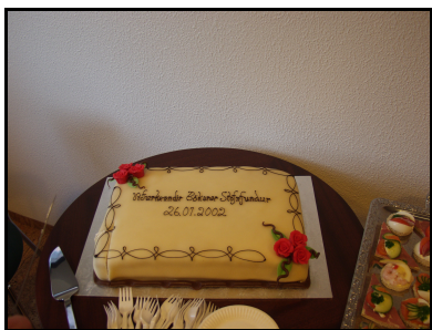
Af stofnfundi Fvb 2002

Myndaalbúm: Heldur utan um myndir úr félagsstarfinu