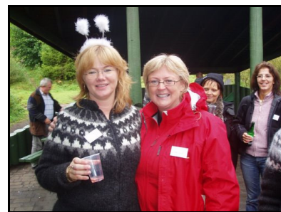
Heiðmerkurferð haustið 2007

Hlekkir: Listi yfir ýmsa nytsamlega hlekki. Ábendingar um fleiri hlekki eru vel þagnar.