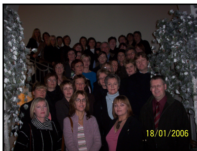
Útskrift viðurkenndra bókara 2006